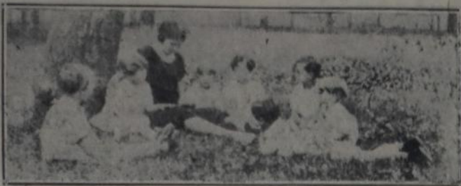
LA PRACTICA DEL NUEVO EVANGELIO

dencia a las amplias contribuciones individuales para apoyar instituciones en manos de los Estados, está ilustrado por el caso de la universidad de California, que en la última década, por término medio recogió anualmente un millón de dólares por lo menos, de fuente privada.