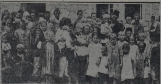
LA FUNDACION ROCKEFELLER EXTIENDE SU BENEFICIOSA ACCION EN MUCHAS PARTES DEL MUNDO. — Niños esperando la vacuna anti-variolosa en Yugoslavia.

tivos recibió 70 millones de dólares. De 1901 a 1910, el término medio de los donativos anuales era de un millón y medio; de 1911 a 1920, de dos millones; de 1921 a 1928 de cinco millones. La universidad de Harvard, por su parte, recibió donativos por tres millones anuales por término medio en 1920 y 1921, y de cuatro millones y medio anuales en los años 1922, 1924 y 1925.